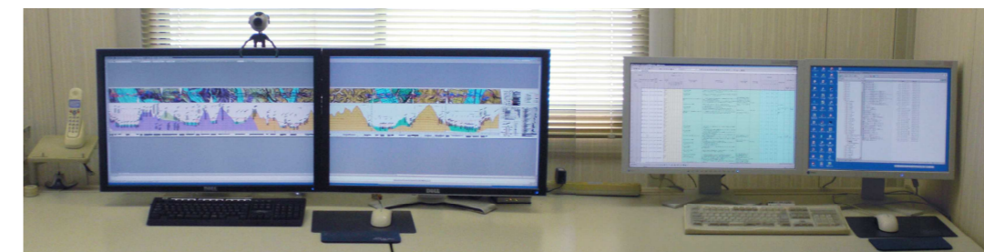
最大30インチの液晶ディスプレイを組み合わせたデュアルモニタ、長尺図面も大きな表も快適に操作可能なデスクワーク環境